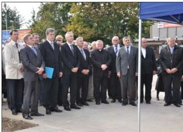
Na slávnostnom odhalení sa zúčastnili významné osobnosti mesta, kraja i Slovenska.

ku ako významnému kňazovi, národovcovi, politikovi, publicistovi, prekladateľovi a signatárovi Martinskej deklarácie z roku 1918. Na seminári sa hovorilo o význame jeho osobnosti v slovenských dejinách, o jeho katolíckom a sociálnom učení i jeho kontaktoch s nitrianskym biskupom Karolom Kmetkom či o jeho vzťahoch s americkými Slováckmi. (sy)