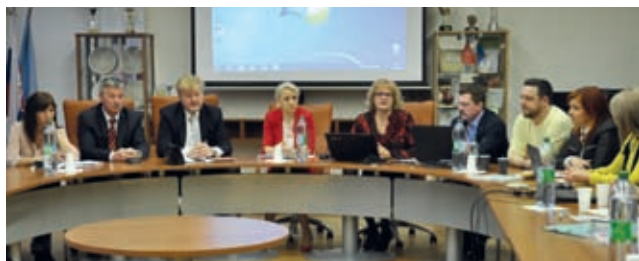
V kongresovej sále sa diskutovalo na tému duálne vzdelávanie a jeho podpora v ZŠ.

„V poslednom období prejavujú žiaci a ich rodičia najväčší záujem o gymnáziá, potom nasledujú obchodné akadémie, stredné zdravotnícke školy a stredné priemyselné školy. Žiaci a ich rodičia, ktorí pri výbere