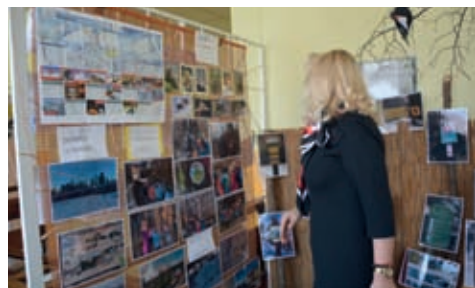
MŠ Golianova v Nitre zrealizovala interný projekt Nesed' doma, hýb sa!