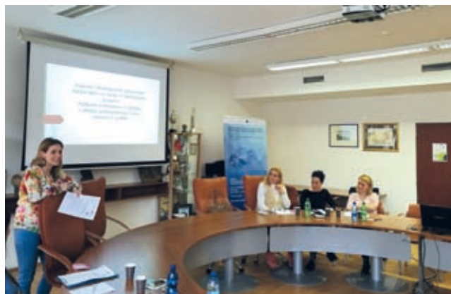
Prvé stretnutie členov odborných pracovných skupín na mestskom úrade.

Participatívny prístup je dôležitý v každej fáze pilotného projektu, ktorého partnermi sú mesto Nitra, Únia nevidiacich a slabozrakých Slovenska a hlavný partner je Úrad splnomocnenca vlády pre rozvoj občianskej spoločnosti. Zástupcovia verejnosti, tak ako aj experti a odborníci