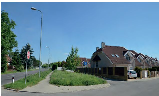
Dnešná nová obytná výstavba na Mikovom dvore.

v Nitre v roku 1960, sa hospodárstvo v priebehu nasledujúcich rokov prebudovalo na modernú veľkovýrobnú poľnohospodársku prevádzku. Po roku 1989 sa v jej are-