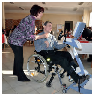
Zdravotný stav klientov by mal zlepšiť aktívno-pasívny prístroj značky Thera Tigo.