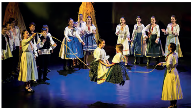
Členovia DFS Borinka už tridsať rokov rozdávaajú svojimi vystúpeniami radosť.