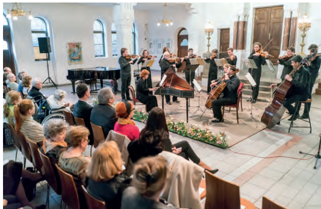
Ilustračná snímka z minulého ročníka NHJ.

pri strunách – gitarový koncert. Koncerty sa taktiež uskutočnia v Synagóge vždy o 17. hodine.