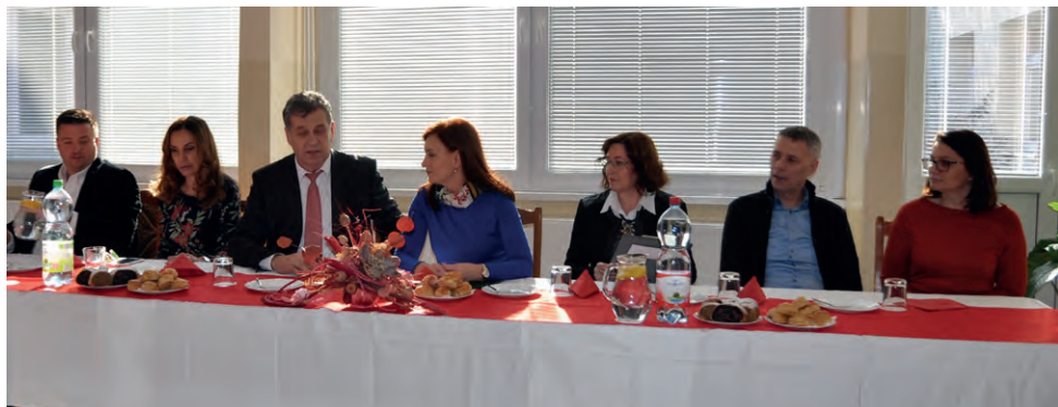
Účastníci slávnostného odovzdávania prístroja

šanie. Boli z neho nadšení a tešia sa na jeho ďalšie používanie.