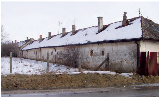
Dodnes sa zachovala obytná budova s bytmi deputátnikov.

Veľkú pohromu spôsobili tiež nájazdy Turkov. Obyvatelia ich s ťažkosťami prežili pravdepodobne len vďaka možnosti úkrytu v neďalekých bažinách. V roku 1678 ju však postihla katastrofa najväčšia. Postihol ju podobný osud, aký postihol aj okolité obce (napr. Tormoš a Malé Janíkovce). Počas protihabsburgského povstania uhorskej šľachty Imricha Tökölliho ju vypálili jeho vojenské hordy. Nastal praktický zánik osady a na jej mieste neskôr vznikol panský majer, v ktorom žilo so svoji-