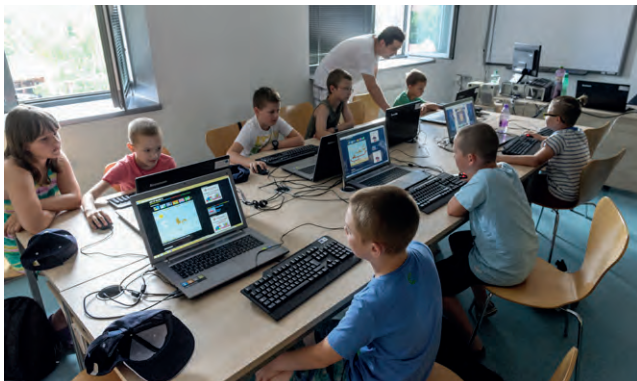
Počítače slúžia žiakom aj pri výučbe.

Nová metodická príručka pre učiteľov prvého stupňa základných bola vytvorená tímom skúsených autorov a učiteľov s dlhoročnou praxou a obsahuje viac ako 200 aktivít na výučbu viac než tridsiatich tém zo Štátneho vzdelávacieho programu. Metodická príručka je priamo prepojená na digitálne materiály z nového vzdelávacieho portálu www.kozmix.sk . Portál momentálne obsahuje viac ako 500 lekcii pre 11 predmetov vyučovaných na prvom stupni základnej školy, viac ako 600 animácií a 1400 digitálnych interaktívnych cvičení. Obsah portálu korešponduje so Štátnym vzdelávacím programom