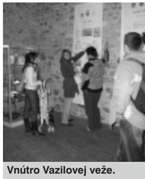
Vnútro Vazilovej veže.