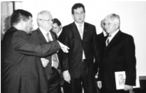
Prezidenta I. Gašparoviča previedli aj po klientskom centre, ktoré obyvateľom do značnej miery urýchlilo a sprehladnilo vybavovanie si úradných záležitostí.

Samospráva každého mesta má financie ako nástroj, ktorými môže prilákať potenciálnych investorov. Nitra je toho