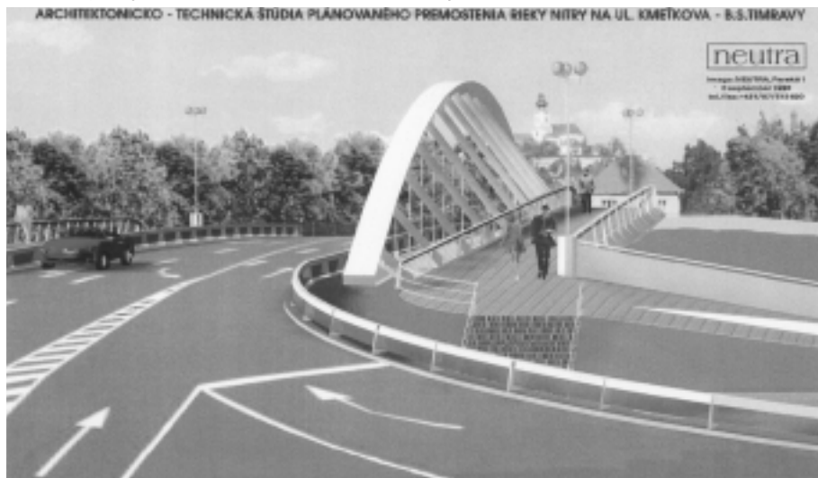
Vizualizácia možného premostenia Wilsonovho nábrežia a Slančíkovej ulice.