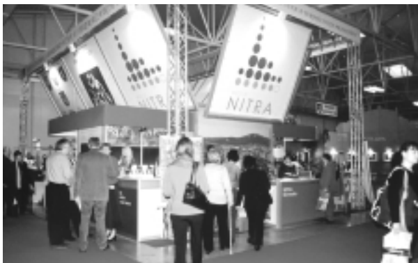
Expozícia mesta Nitra na medzinárodnom veľtrhu cestovného ruchu ITF Slovakiatour.