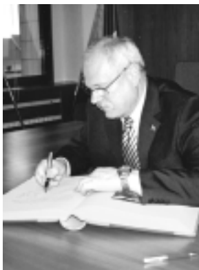
Prezident sa podpísal do pamätnej knihy.

hy mesta, sa hlava štátu odobrala do zasadacej sály mestského úradu. Tu už na neho čakali poslanci mestského zastupiteľstva, zamestnanci mest-