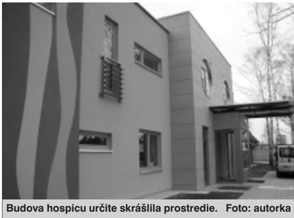
Budova hospicu určite skrášľila prostredie.