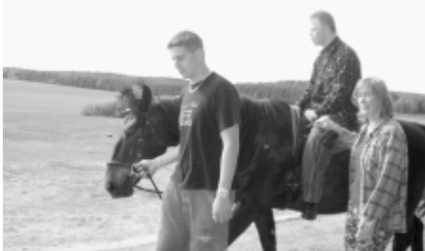
V rámci rehabilitácie si vyskúšali hipoterapiu.

Svoje komunikačné zručnosti si budú môcť overiť napr. samostatným nákupom v obchodnom centre, kam sa budú musieť prepraviť sami bez pomoci vychovávateľov.