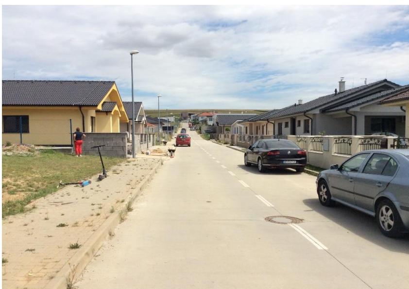
Pri studničke – IBV Agro Janíkovce