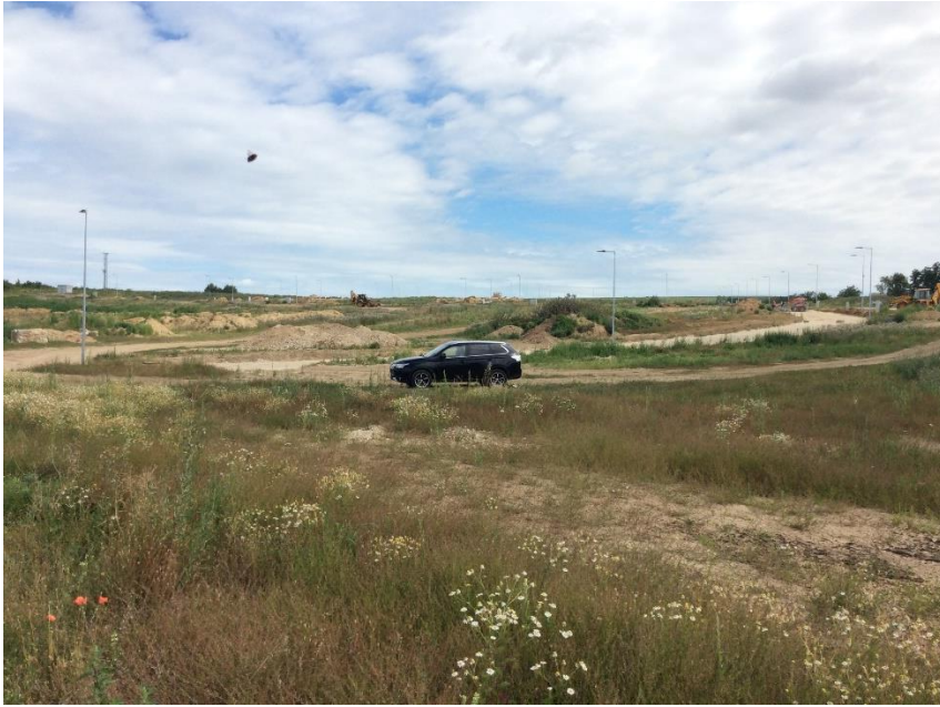
Obytná skupina Nové Janíkovce