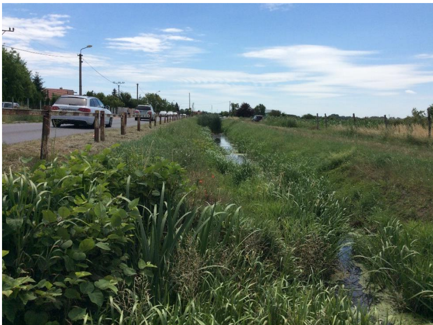
ul. Dlhá - Janíkovský kanál