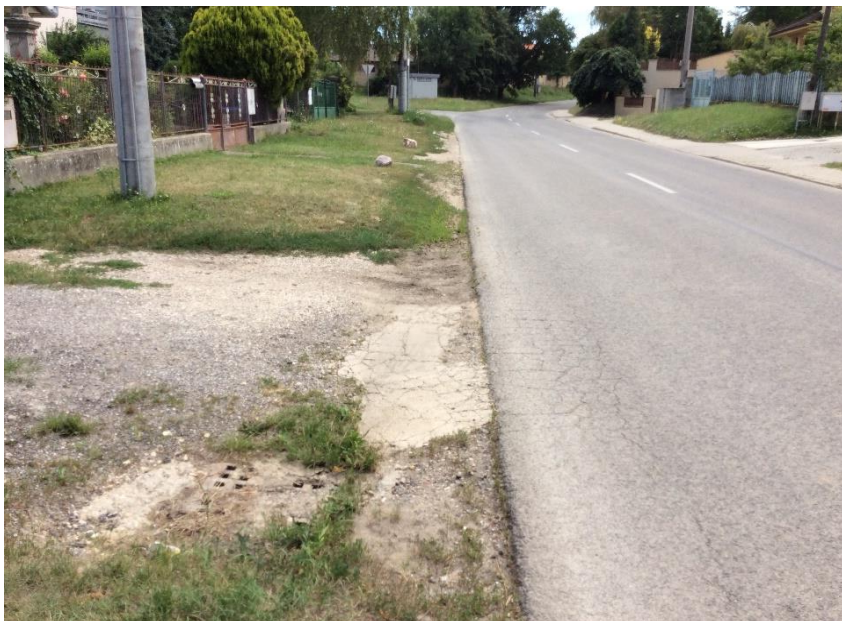
výust Hlavná ulica