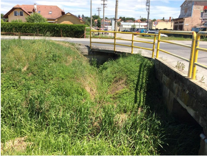
most Dlhá- Letecká STK