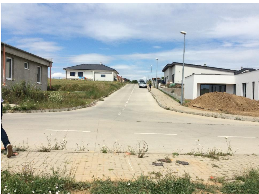
IBV Agro Janíkovce