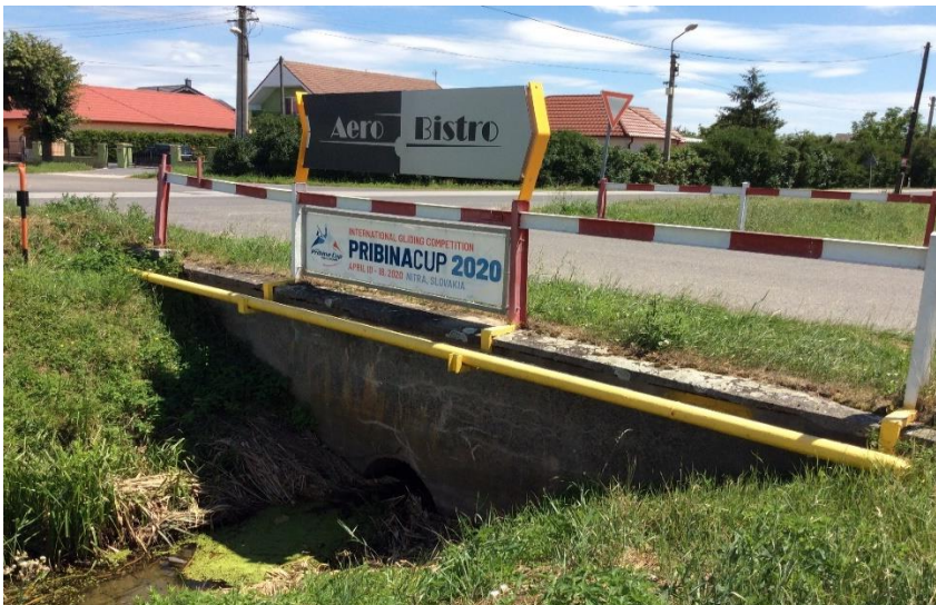
most Dlhá- Hlavná Letisko