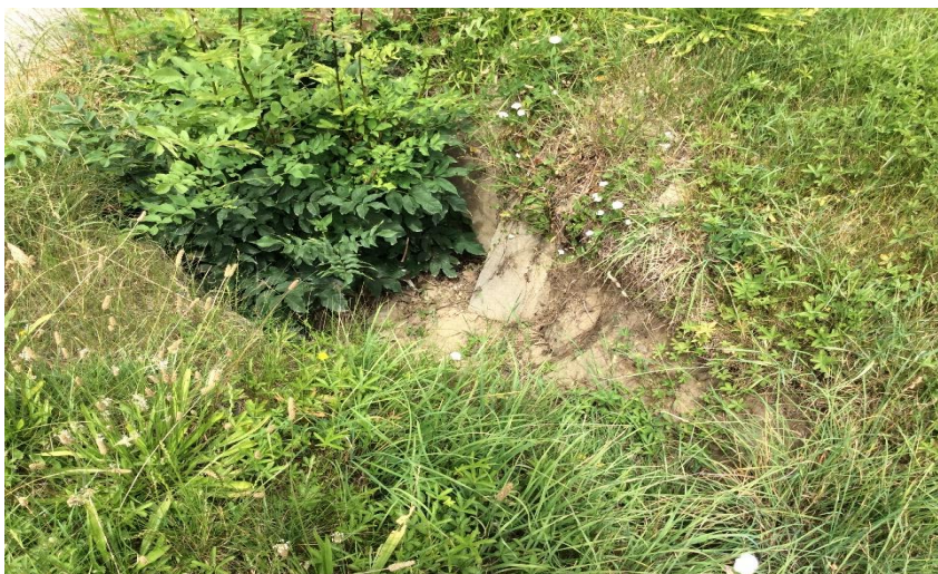
výúst Rabčekova - Hlavná