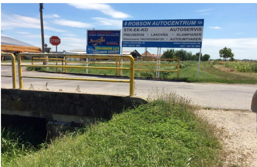
most Dlhá - Letecká STK