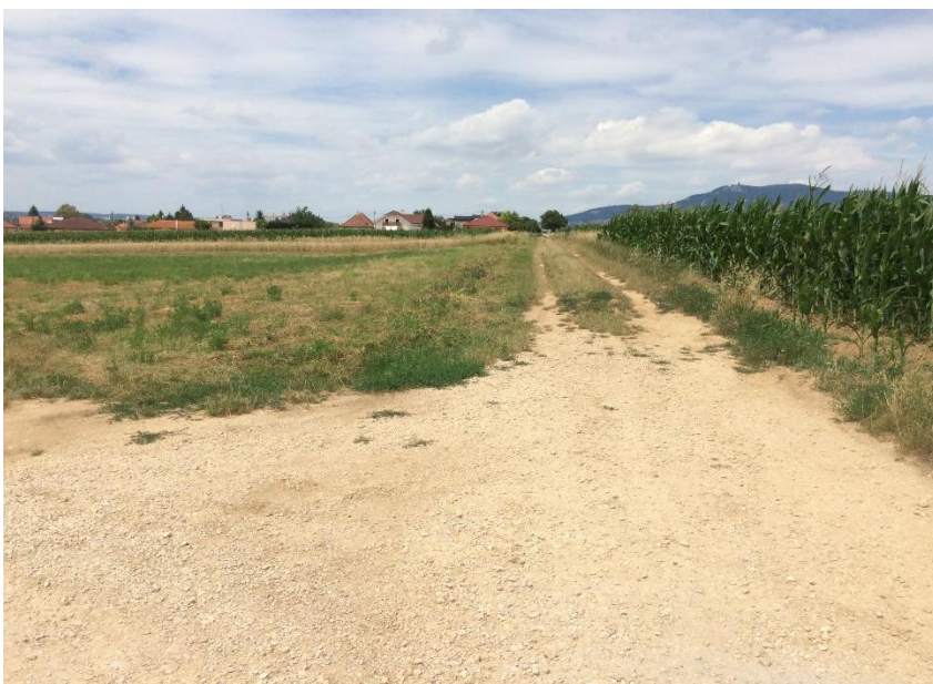
Hanácka ulica - Pri Dolci