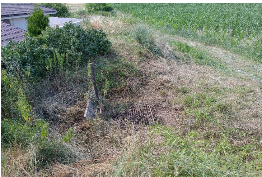
záchytná jama - J.C.Hronského