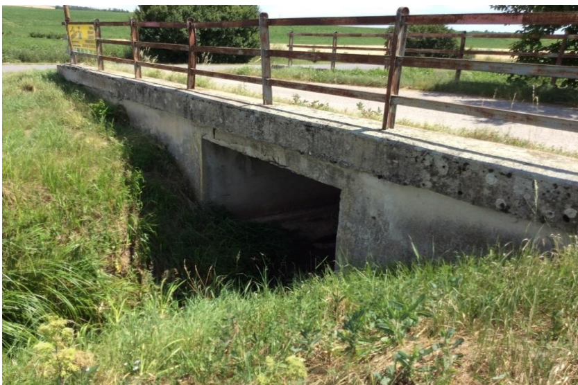
most Dlhá letisko