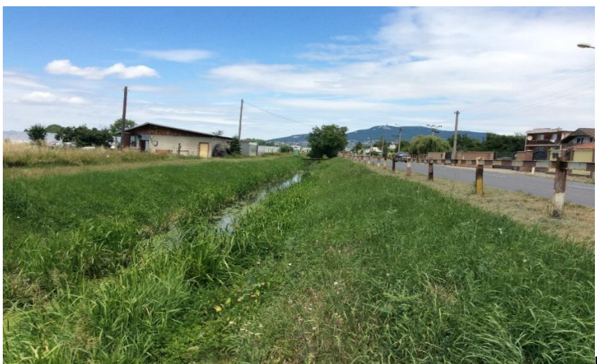
ul. Dlhá – Janíkovský kanál