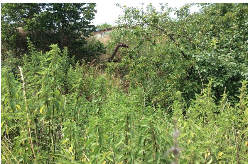
záchytná jama Willermova ulica