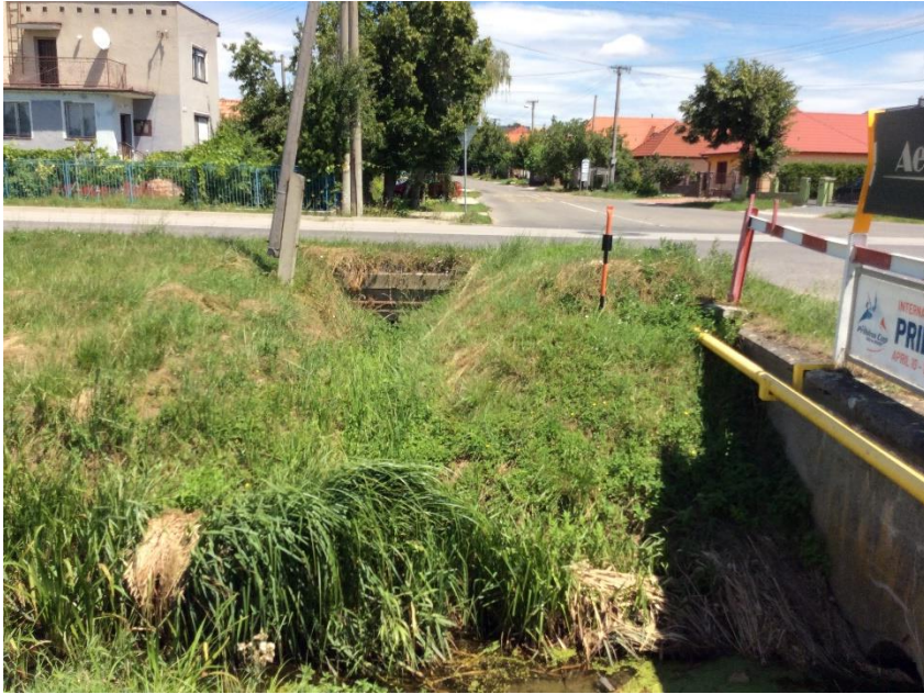
most Dlhá - Hlavná Letisko