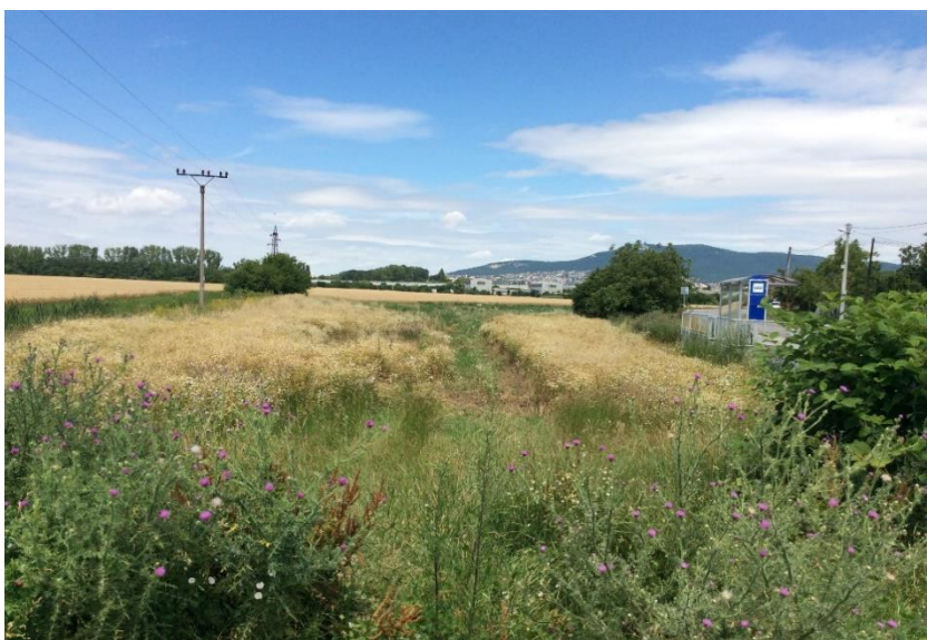
Nové Janíkovce - vsaky