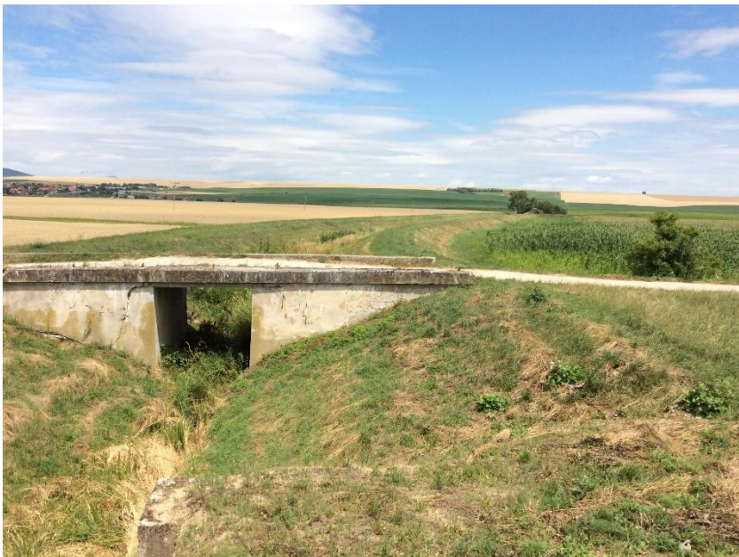
Janíkovský kanál – výust rieka Nitra