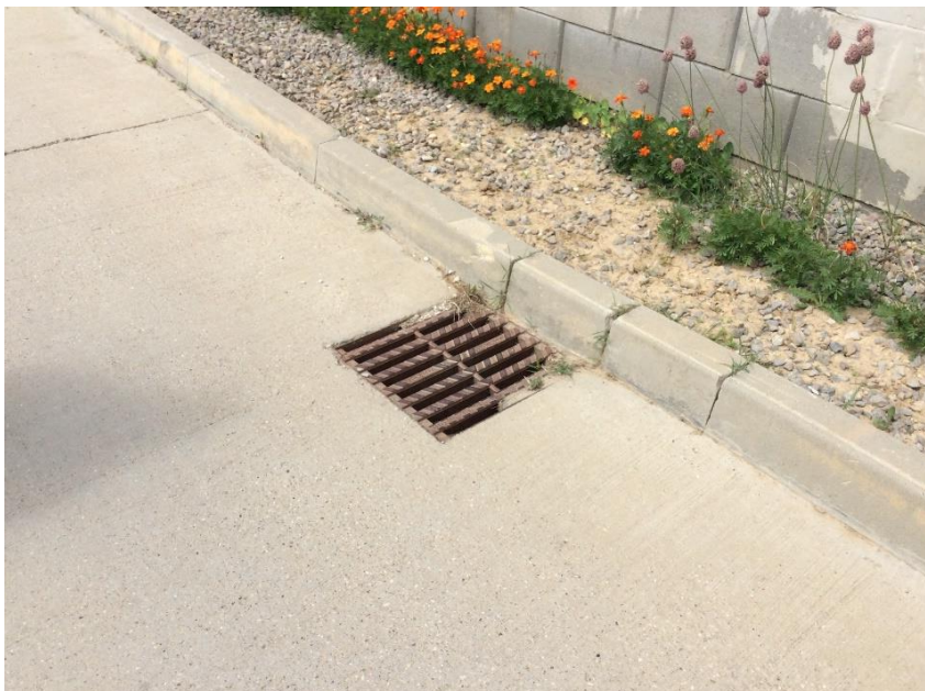
Pri studničke – IBV Agro Janíkovce