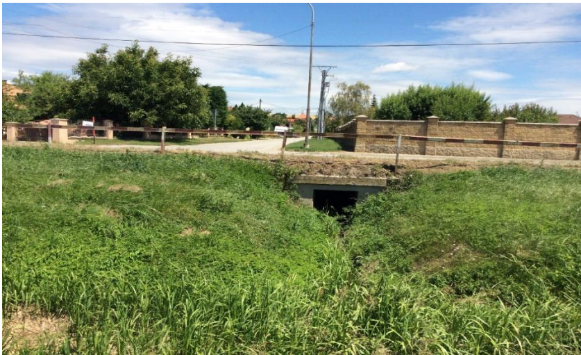
výúst Krížna - Dlhá