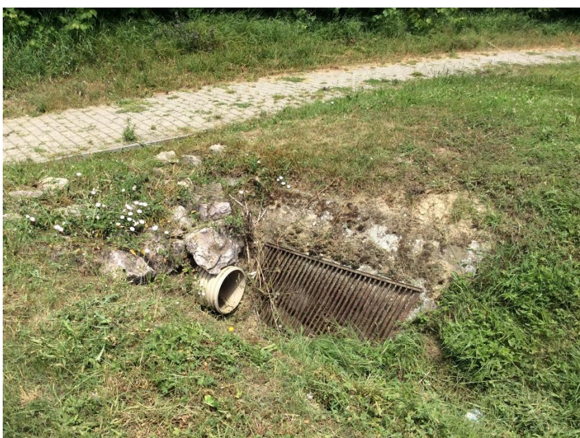
Willermova ulica – šachta