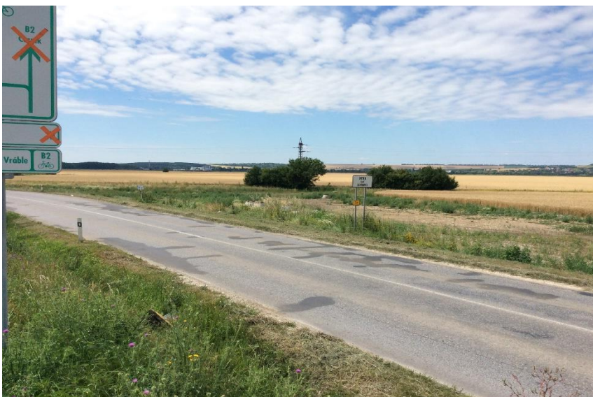
OS Nové Janíkovce vsakovacie jamy