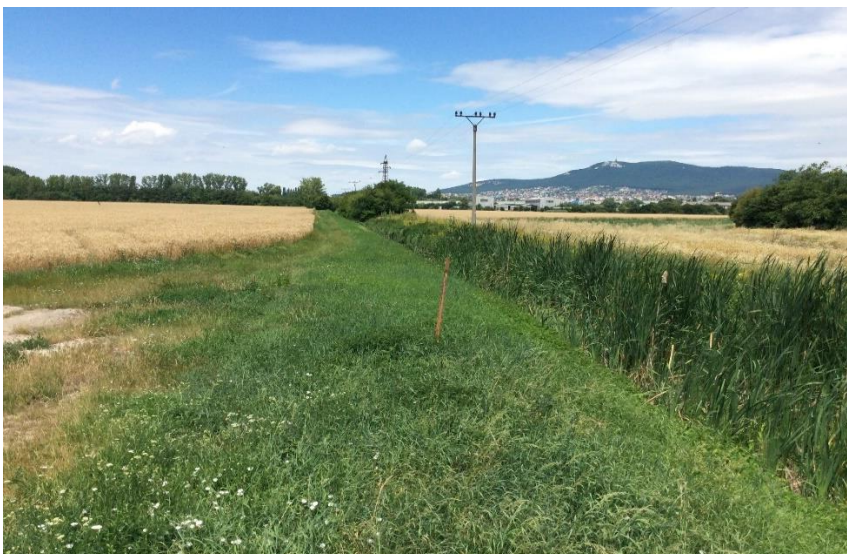
Janíkovský kanál od AX