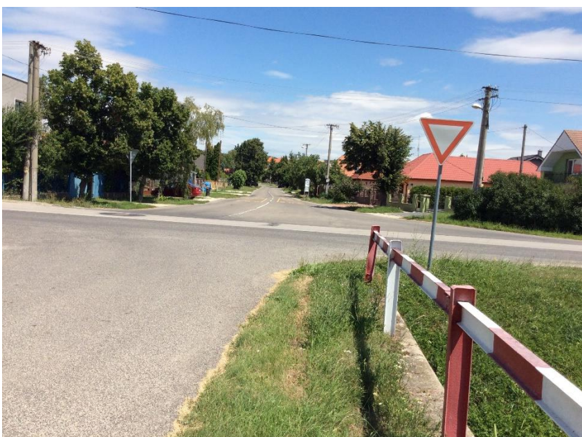
križovatka Dlhá - Hlavná