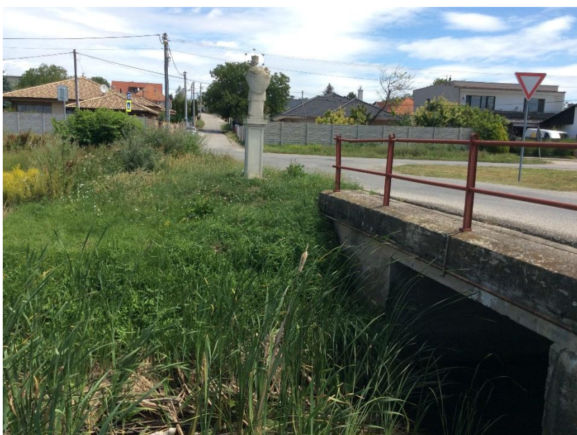
most Dlhá - Slamková