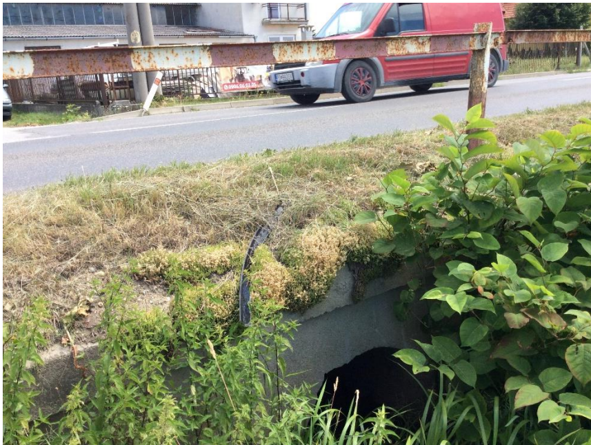
ul. Dlhá výúst s Willermovej