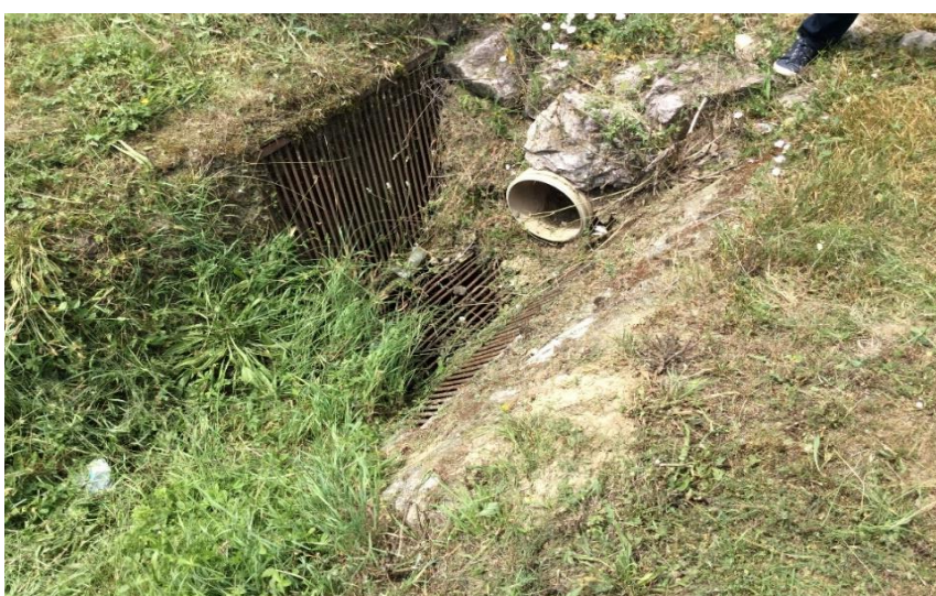
Willermova-Hlavná ul. šachta