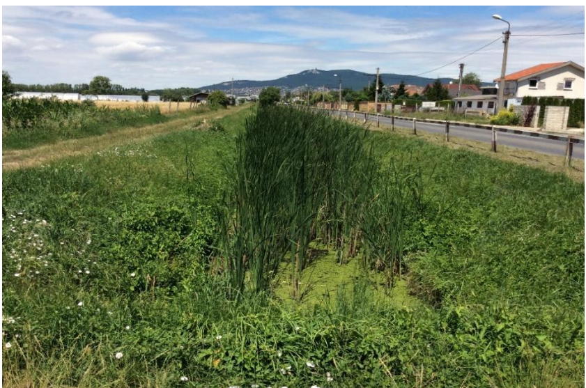
Dlhá ul. - Janíkovský kanál