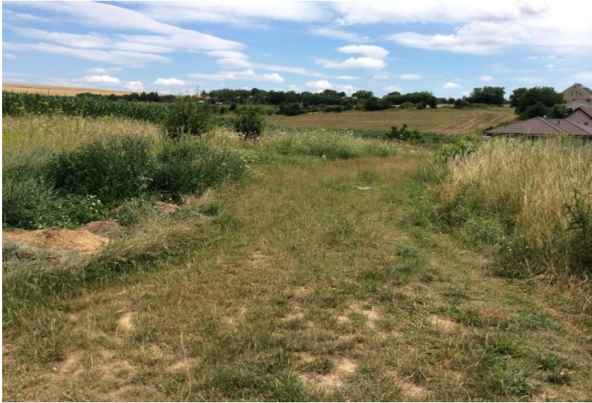
ulica Hanácka - šachta