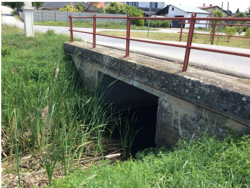
most Dlhá - Slamková