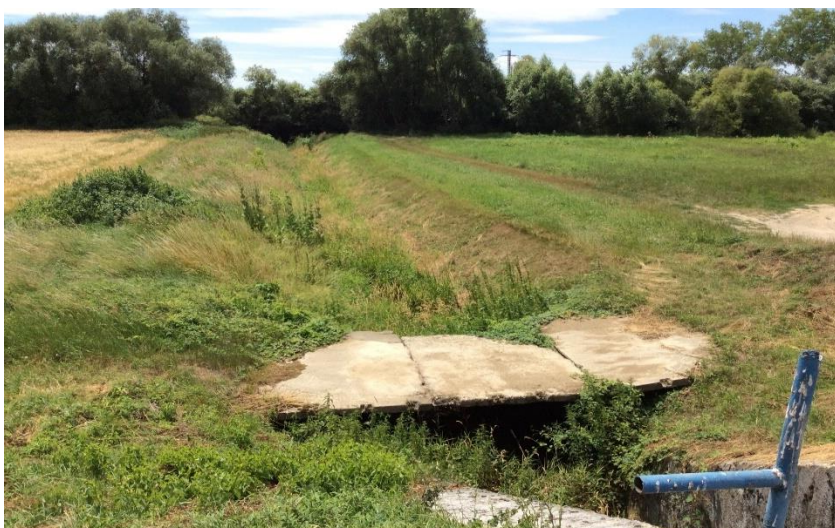
výúst smer rieka Nitra