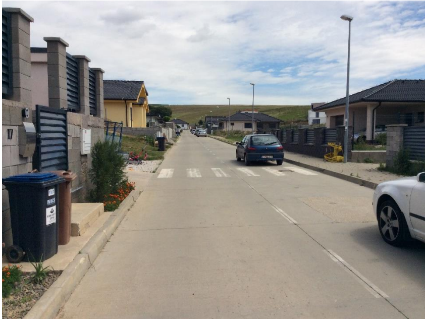
Pri studničke IBV Agro Janíkovce