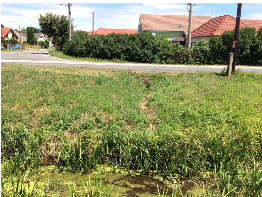
výúst z rigolu Hlavná - Dlhá