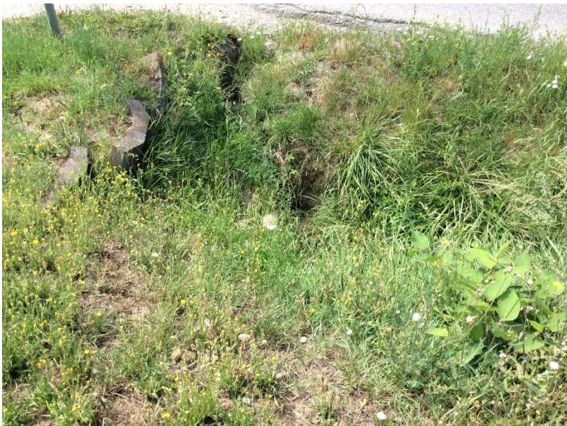
výúst Slamkova ulica