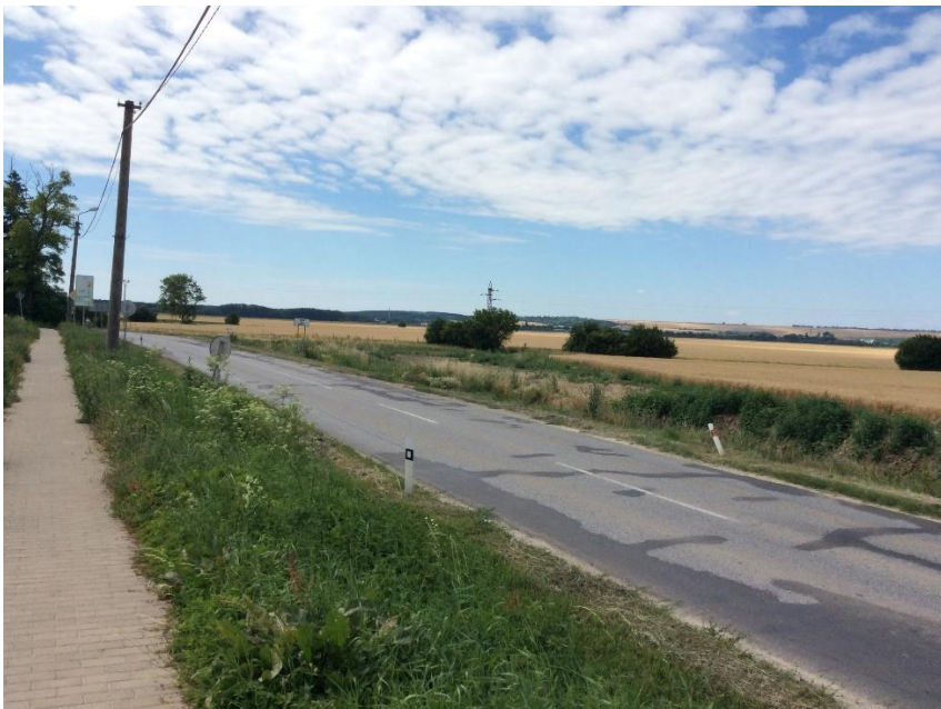
OS Nové Janíkovce vsakovacie jamy