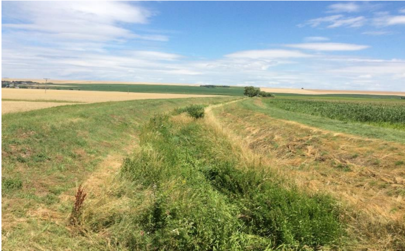
Janíkovský kanál extravilán smer rieka