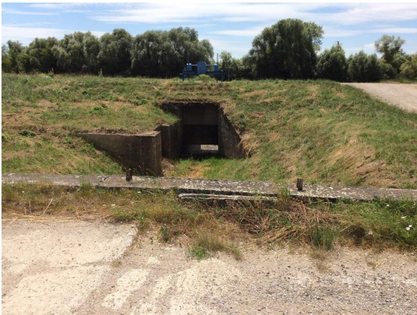
výust Janíkovský kanál – rieka Nitra