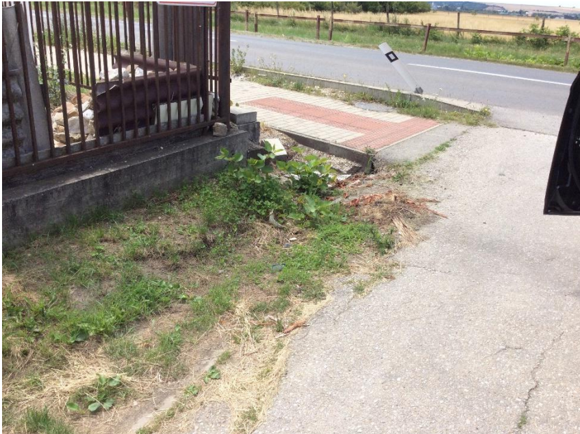
Willermova x Dlhá