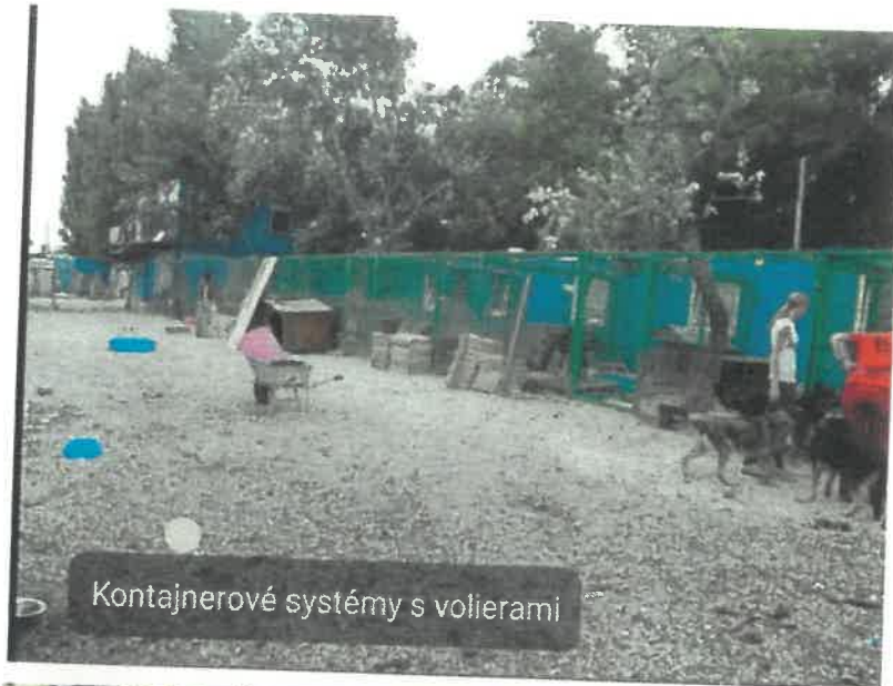
Kontajnerové systémy s volierami