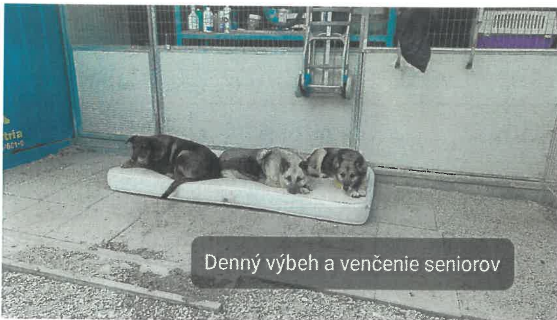
Denný výbeh a venčenie seniorov