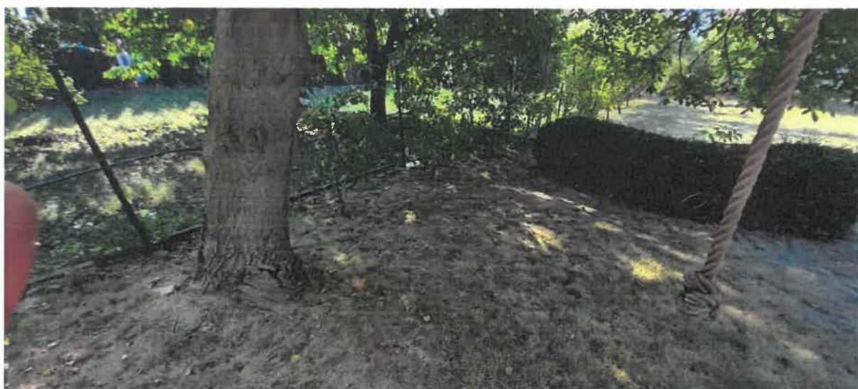
Obr. č. 4