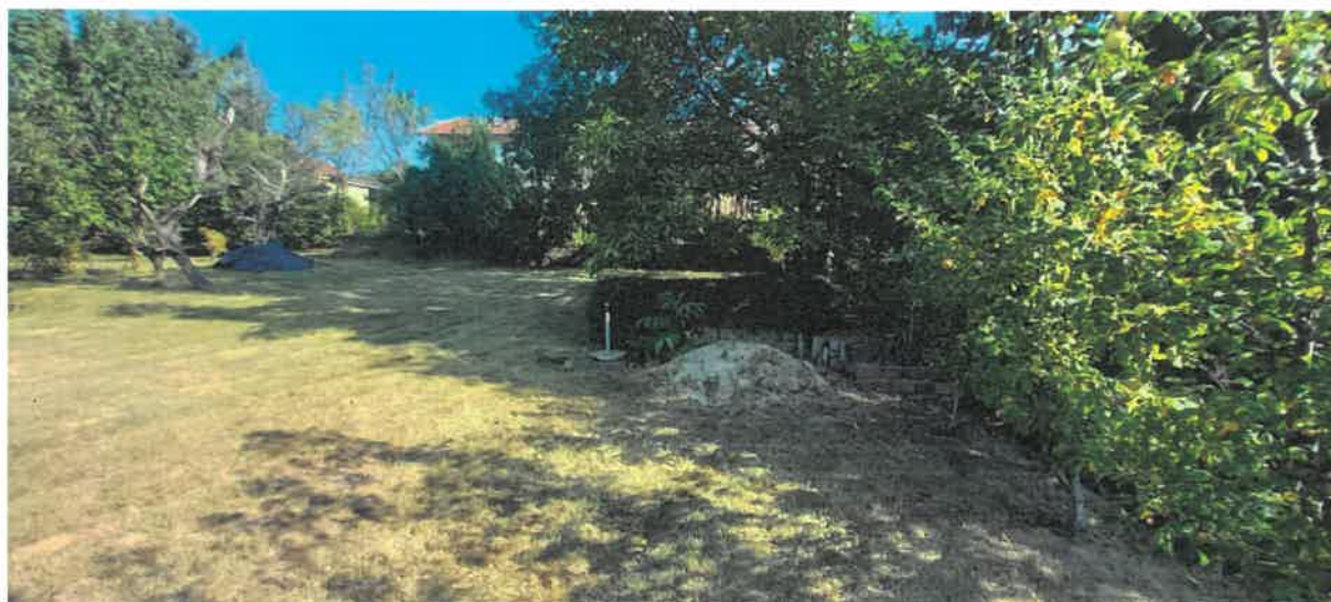
Obr. č. 6