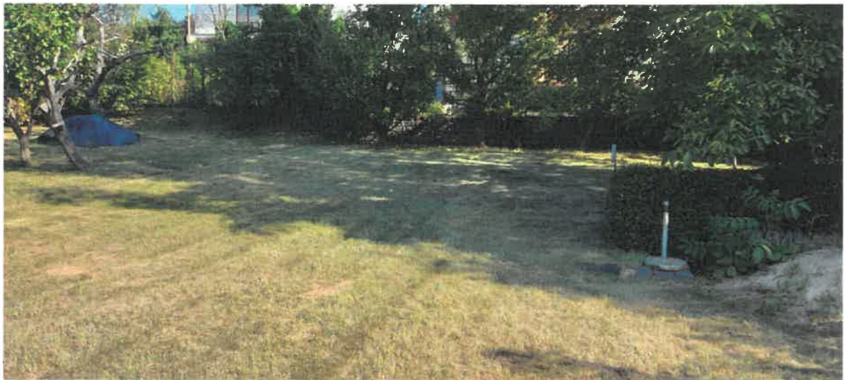
Obr. č. 8