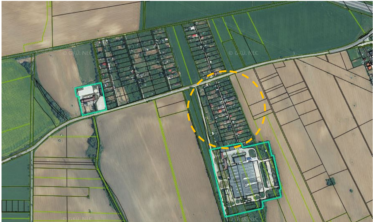
Obr. 2 Situácia širšie vzťahy – s vyznačením územia

Záujmové územie je z hľadiska územného a funkčného podľa platného ÚPNO mesta Nitra určené ako produkčná vegetácia s významnou a ekostabilizačnou alebo environmentálnou funkciou (záhradkárske osady).