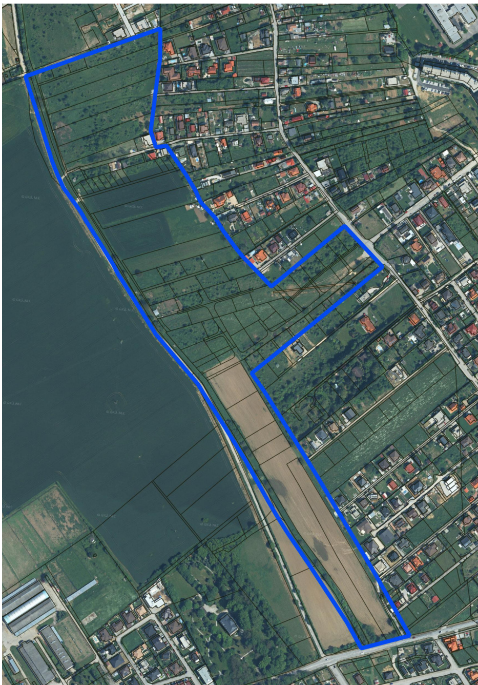
Obr. 1 Záujmové územie o výmere cca 14,20 ha

Útvar hlavného architekta obdržal žiadosť vlastníka časti pozemkov v lokalite Nitra -Šúdol o obstaranie územného plánu zóny pre možnosť stavebného využitia nezastavaných parciel situovaných v k..ú. Párovské háje rámcovo graficky zdokumentovaných na obr. č. 1 Záujmové územie s ponukou úhrady nákladov na obstaranie predmetného Územného plánu zóny Pod Šúdolskou ulicou, Nitra (ďalej len ÚPNZ).