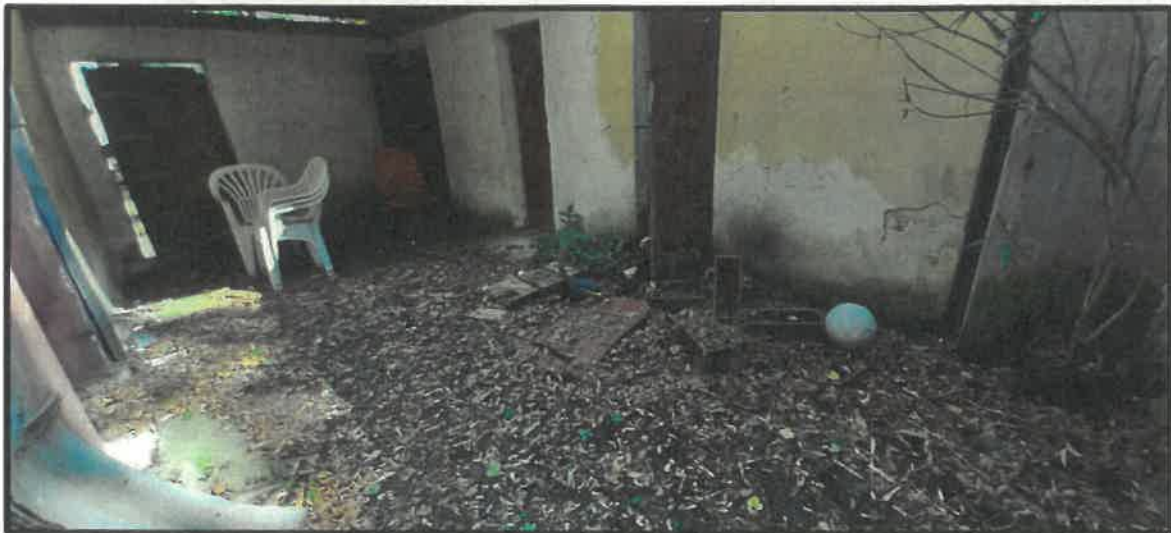
Obr. č. 16