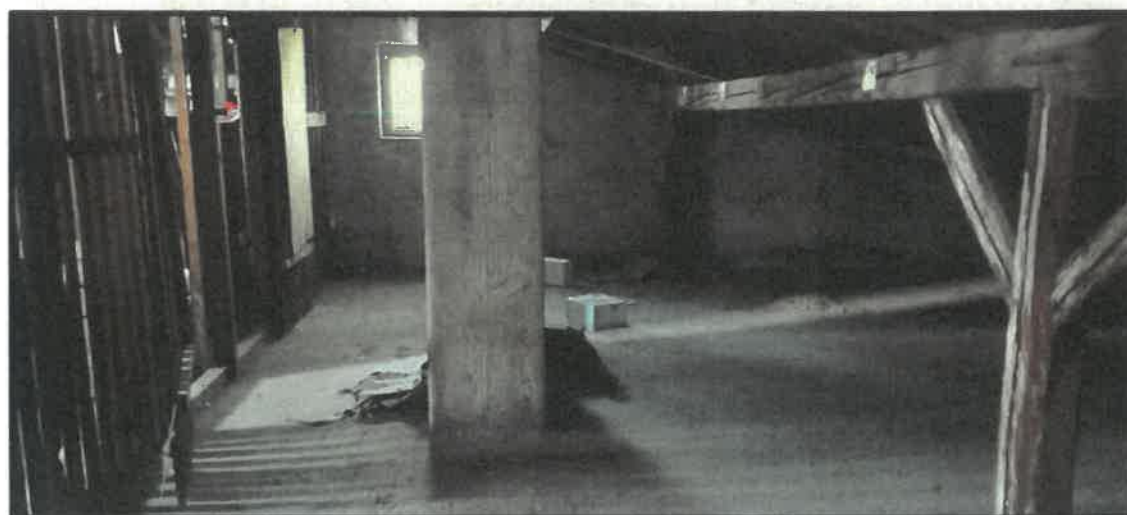
Obr. č. 14