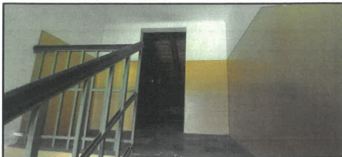
obr. č. 10