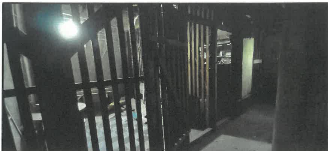
Obr. č. 12