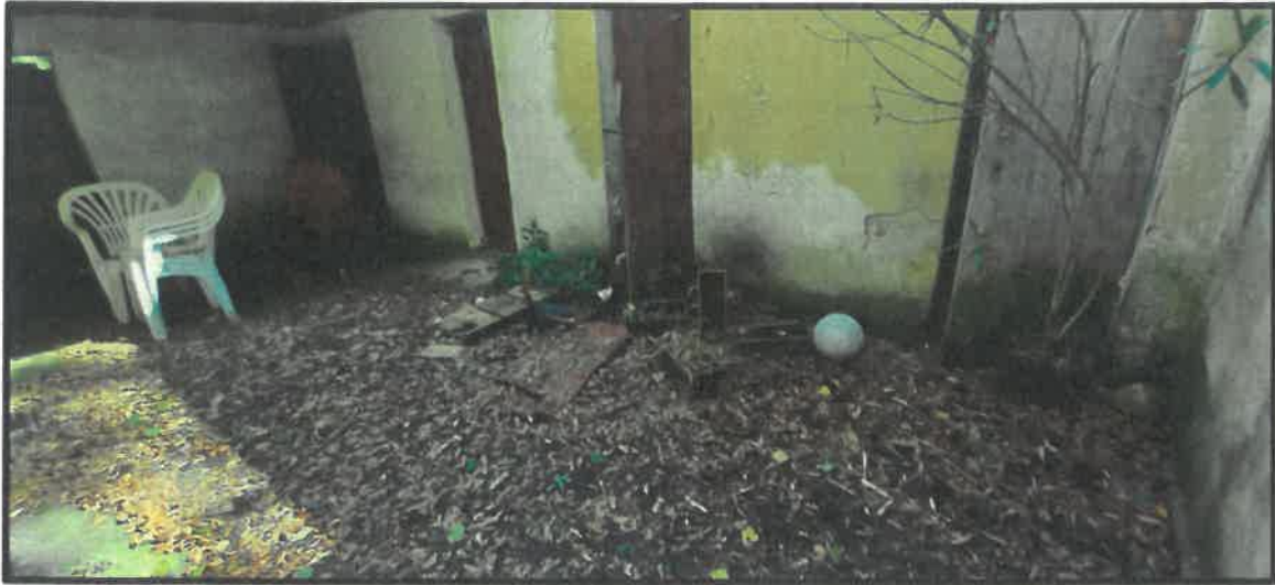
Obr. č. 15

✓ vedľajšia stavba – skladovací priestor k bytom (obr. č. 15 - 19)