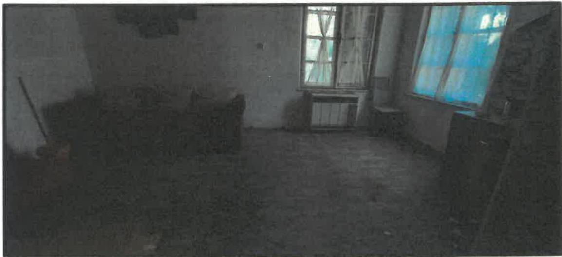
Obr. č. 8