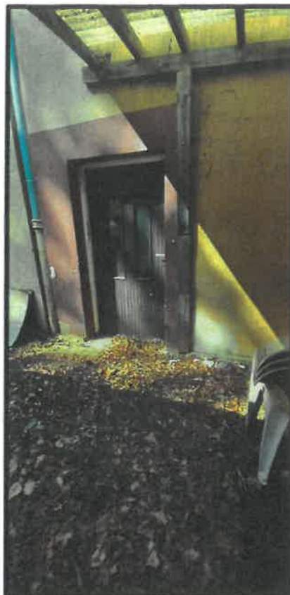
Obr. č. 18