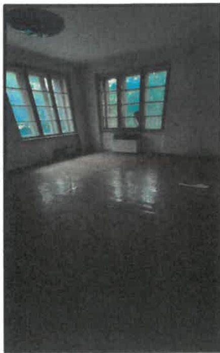
obr. č. 3