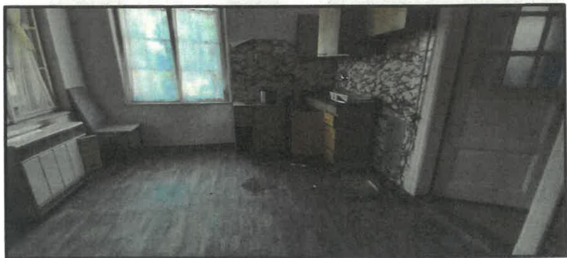
Obr. č. 9