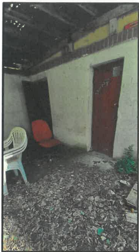
Obr. č. 17