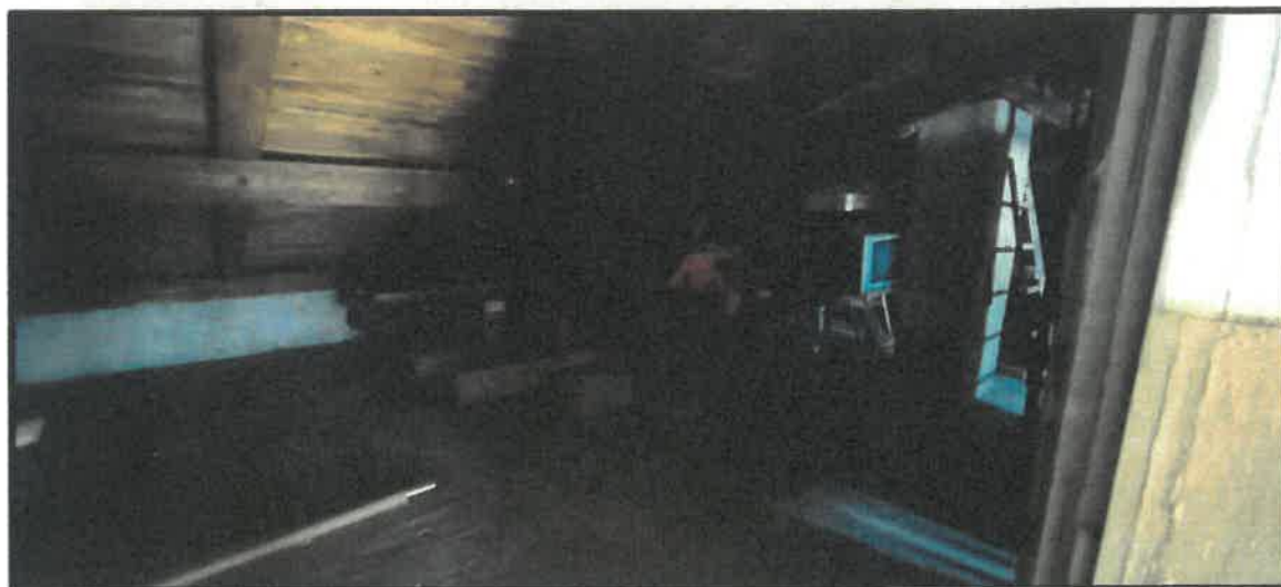
Obr. č. 11