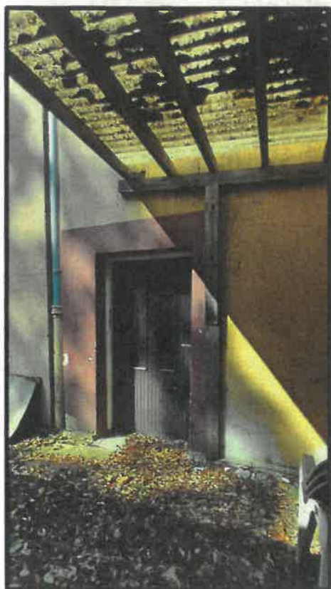
Obr. č. 19