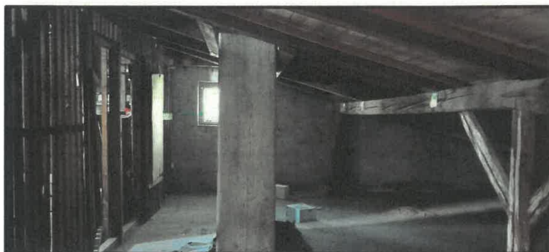
Obr. č. 13