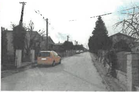
Prístup k hodnotenému pozemku cez parc.č. 5695/9