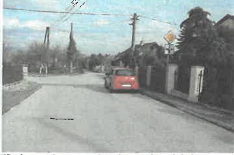
Hurbanova ulica pred hodnoteným pozemkom