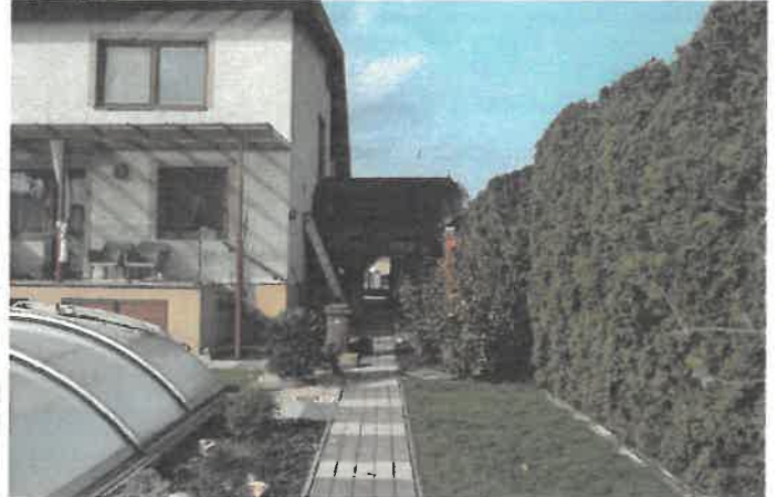
Okrasná záhrada na hodnotenom pozemku