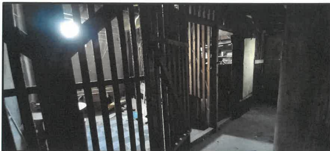
Obr. č. 12