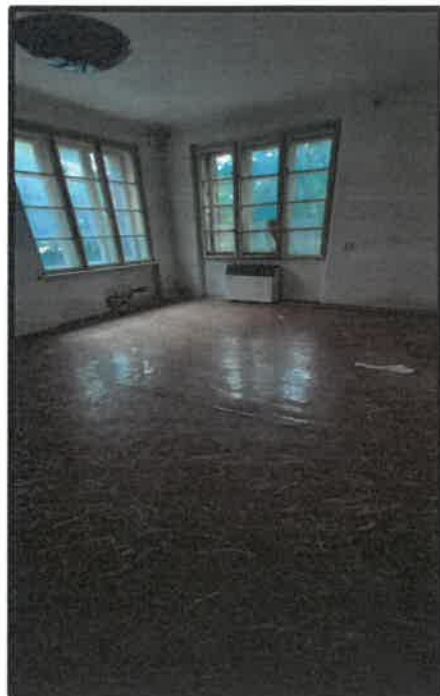
obr. č. 3