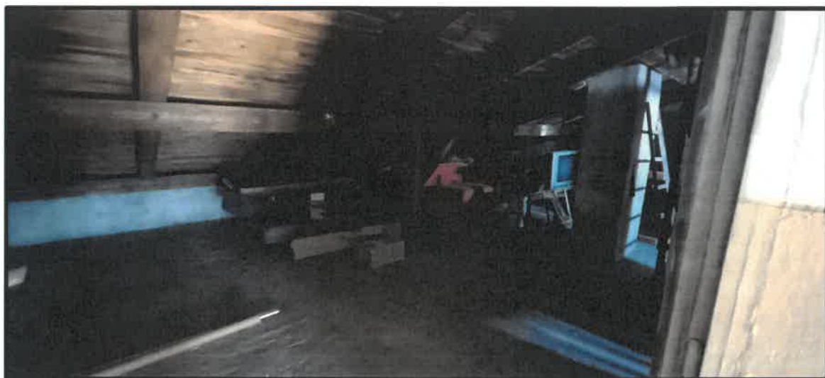
Obr. č. 11