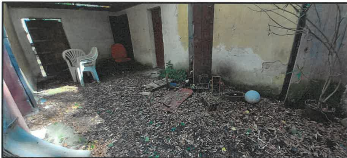
Obr. č. 16