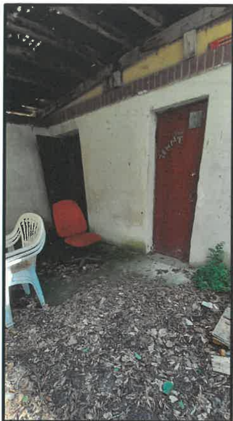
Obr. č. 17