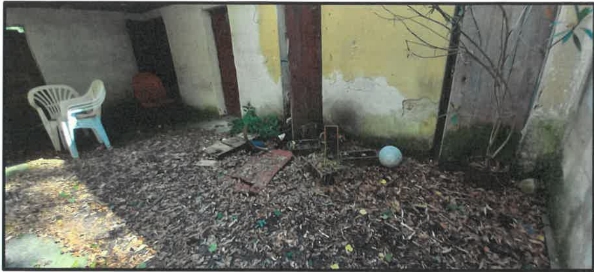
Obr. č. 15

✓ vedľajšia stavba – skladovací priestor k bytom (obr. č. 15 - 19)