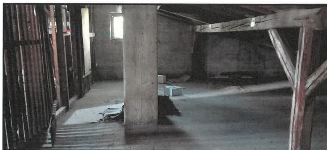
Obr. č. 14