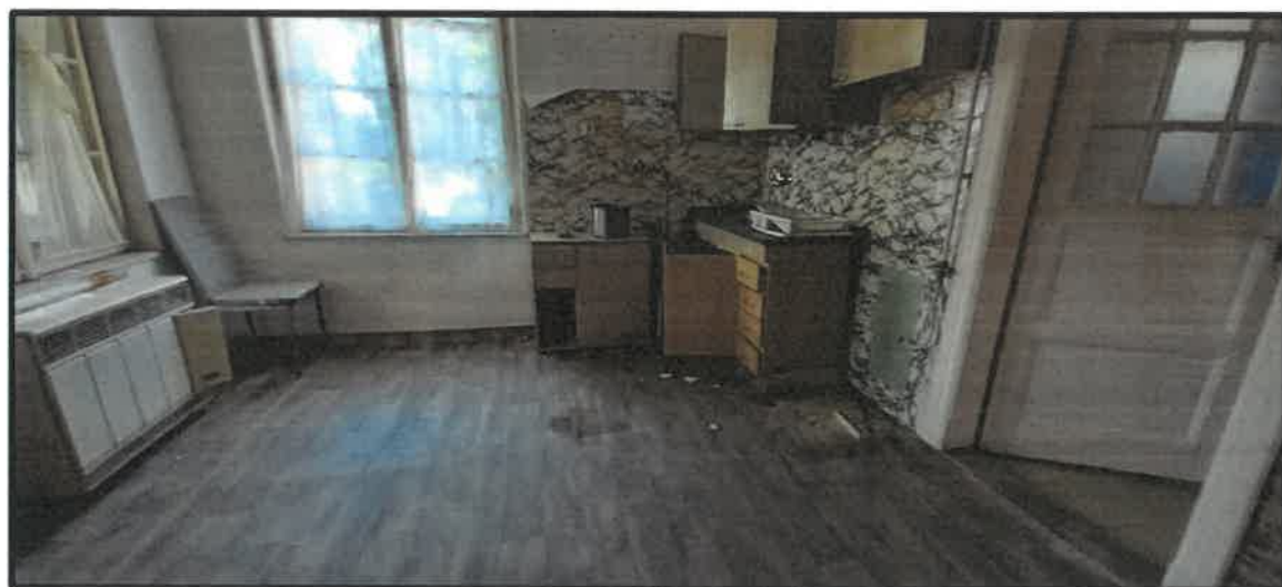
Obr. č. 9