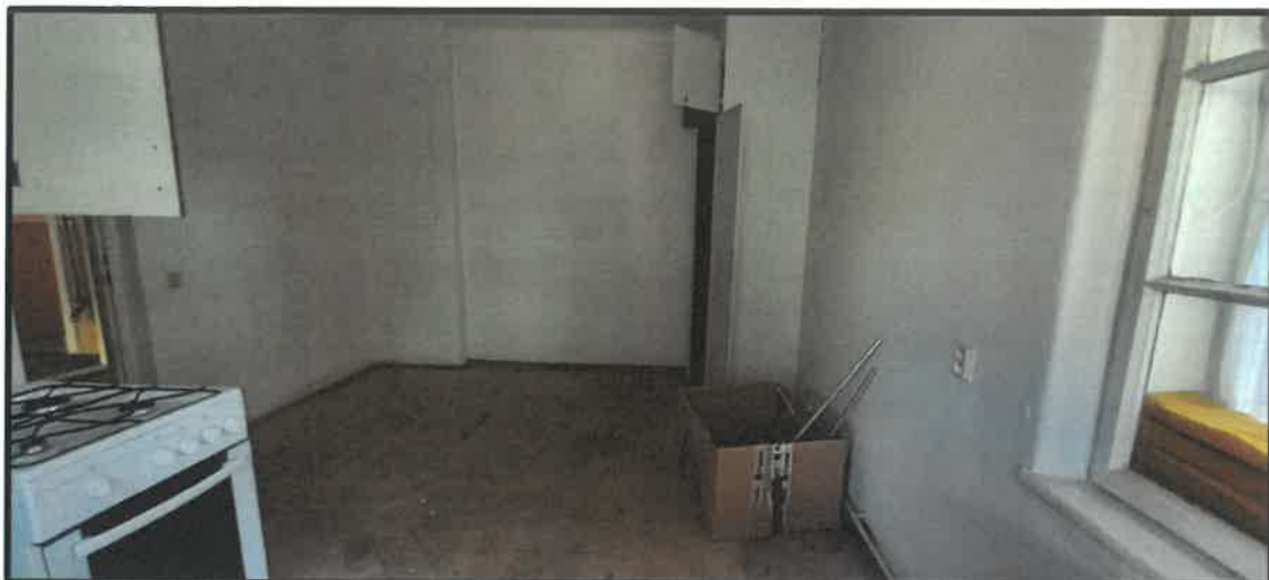
Obr. č. 7