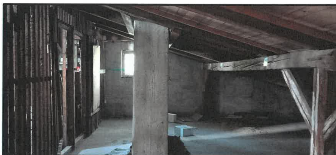
Obr. č. 13