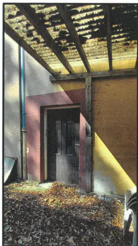
Obr. č. 19