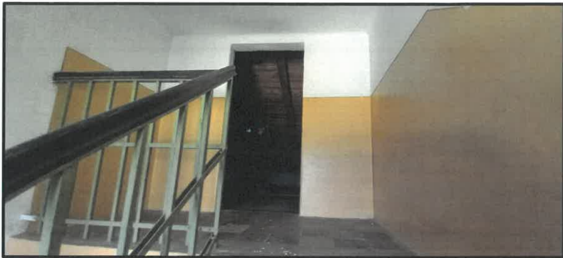
obr. č. 10