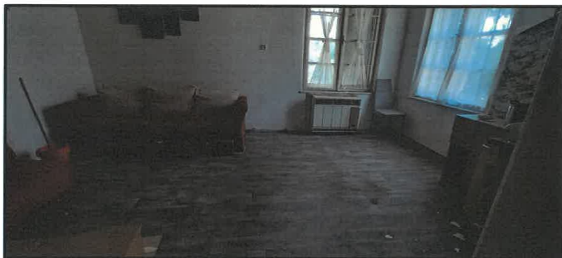
Obr. č. 8