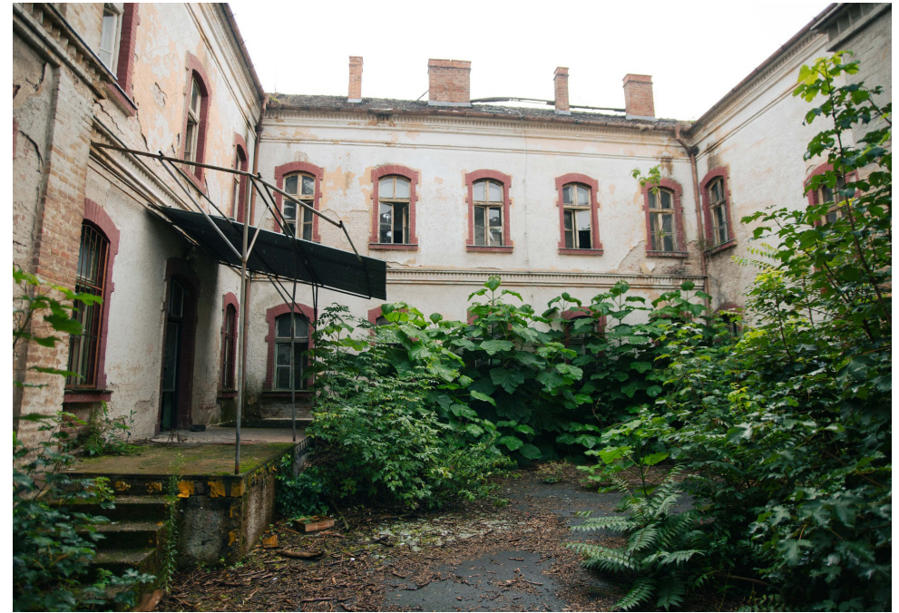
↑ Budova bývalej nemocnice.

Nad rámec ľudských potrieb je nutné pri revitalizácii zohľadniť potreby prírodných aktérov. Vytvoriť podmienky a dostatočnú diverzitu pre rôzne druhy zvierat.