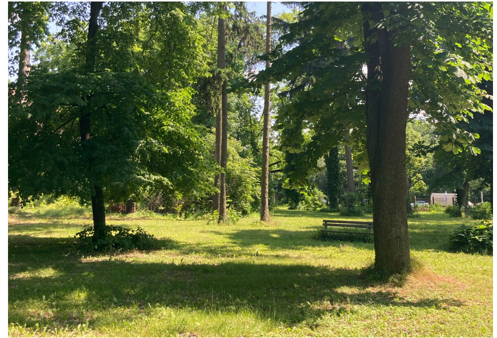
↑ Vzrastlá zeleň v areáli.

V súvislosti s týmito odporúčaniami je podstatným doriešiť majetkový vzťah k vlastníctvu vymedzených pozemkov parku a stanoviť správcu plôch verejnej zelene a prvkov verejných priestorov.