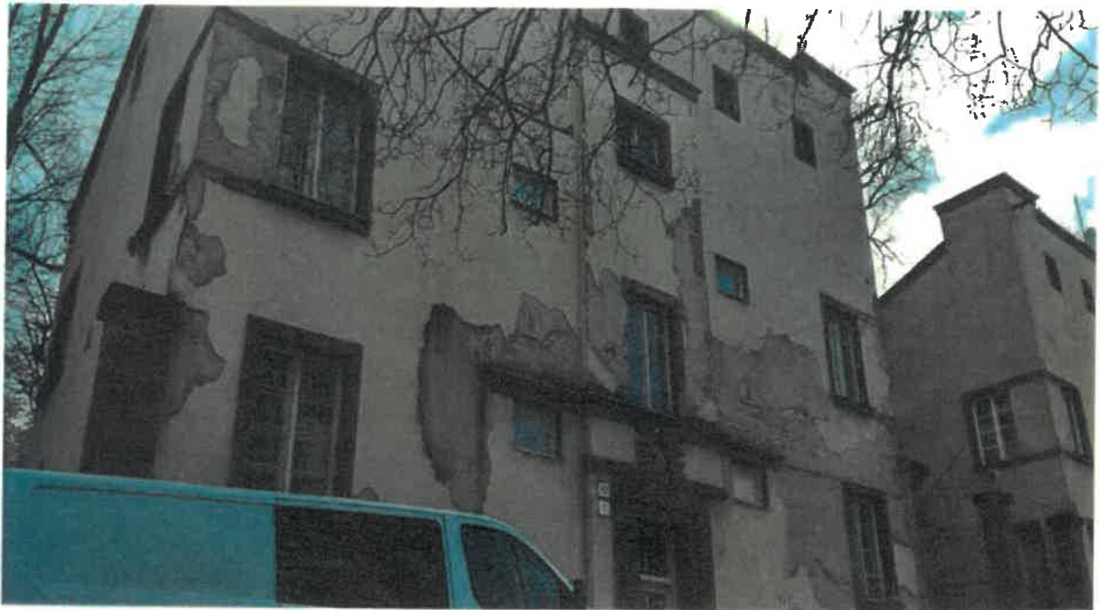
Misionárska ulica č. 1, parcela registra C KN č. 4380, súp. č. 721