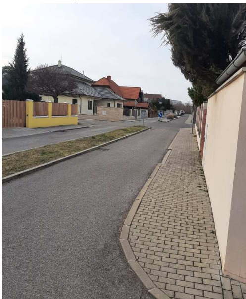
Príloha 1 - parkovanie