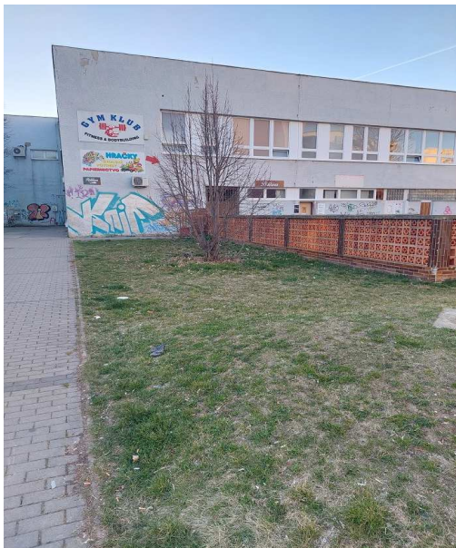
Príloha 7 – Lipa (smeti)