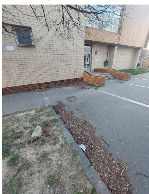
Príloha 4 – Lipa (smeti)