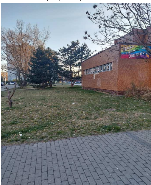
Príloha 5 – Lipa (smeti)