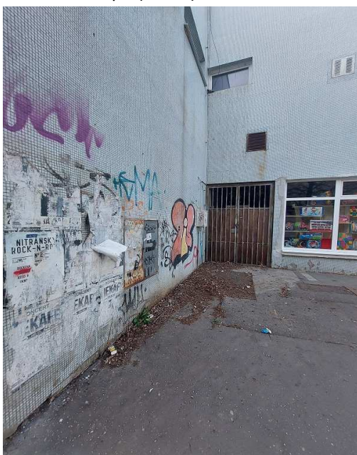
Príloha 3 – Lipa (smeti)