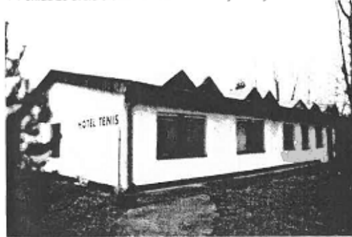
▼ Pohľad zo dvora areálu na hotel - severovýchodný.