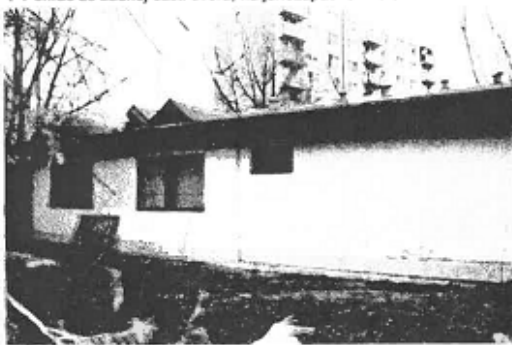
▼ Pohľad zo zadnej časti dvora, na juhozápadné krídlo hotela.