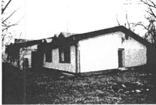
▼ Pohľad zo dvora tenisového areálu na hotel - západný.