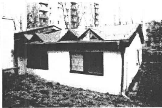
▼ Pohľad zo zadnej časti dvora na severovýchodné krídlo hotela.