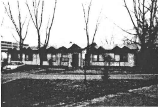
▼ Pohľad z Ďumbierskej ulice na budovu hotela - severozápadný.