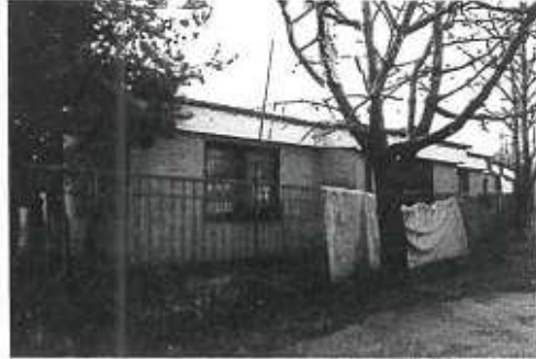
▼ Pohľad z Ďumbierskej ul. na budovu Šport centra - severný