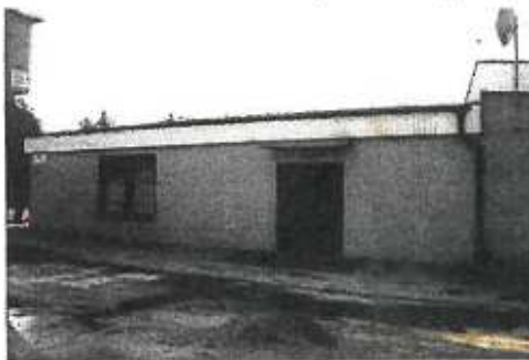
▼ Pohľad zo dvora areálu na budovu Šport centra - s. východný