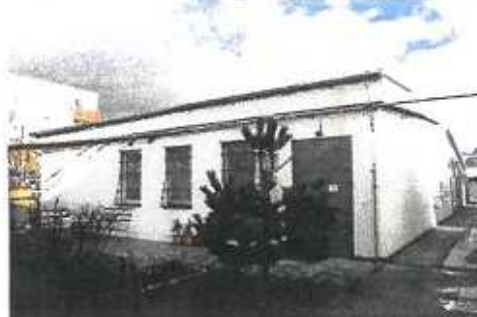
▼ Pohľad zo dvora areálu na budovu Šport centra - juhozápadný