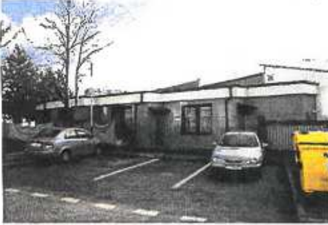
▼ Pohľad z Ďumbierskej ul. na budovu Šport centra - s. západný