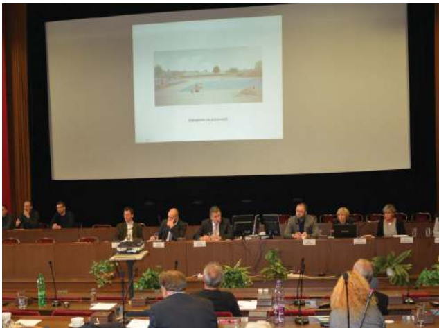
Pohľad do rokovacej sály.