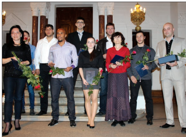
Najlepší jednotlivci – seniori.