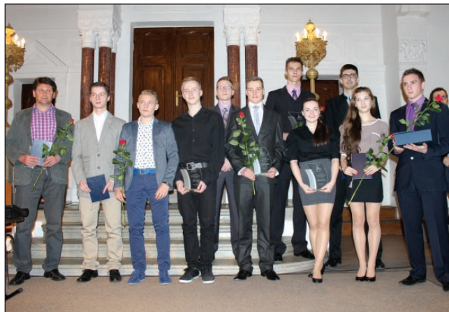
Ocenené boli aj juniorské družstvá.