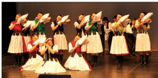
Súbor Furmani sa predstavil v takmer 2-hodinovom pásme.