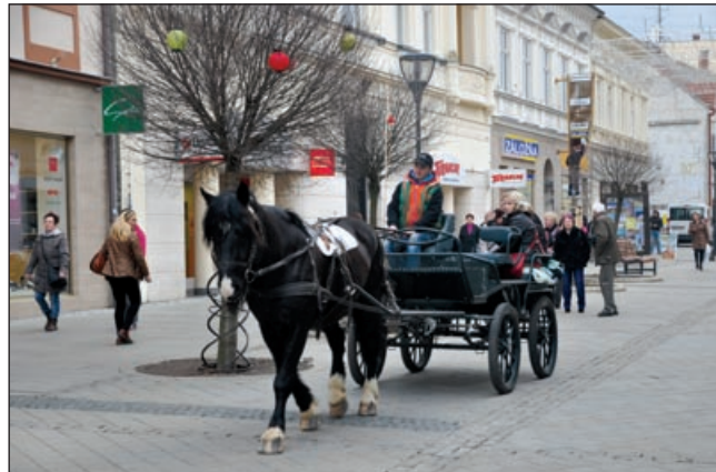
Po pešej zóne jazdil konský povoz.