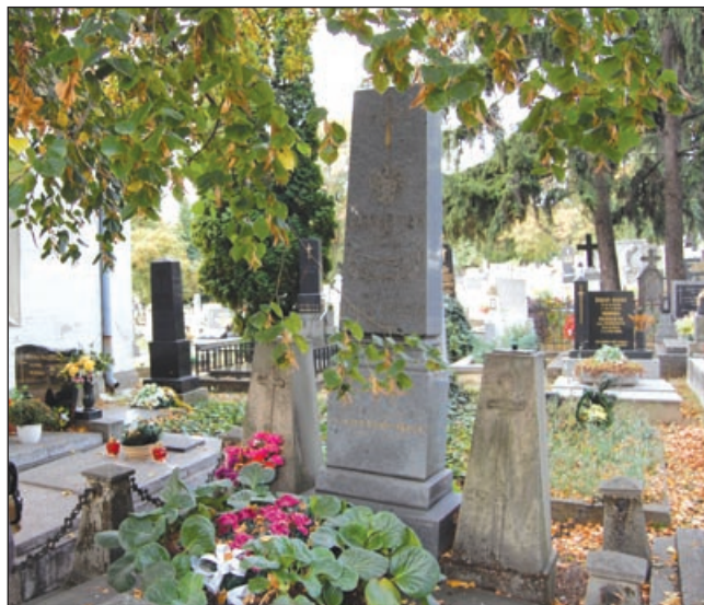
Mestský cintorín je najstarší v Nitre