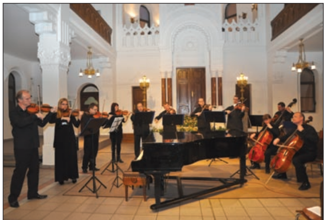
Na otváracom koncerte sa predstavil sláčikový súbor ŠKO ARCHI DI SLOVAKIA.

Záverečný koncert Nitrianskej hudobnej jari sa uskutoční 13. apríla a predstaví sa na ňom komorný súbor Trio Martinů z Českej republiky. (S)