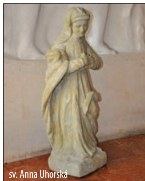
sv. Anna Uhorská

Na zozname sú aj tri cintoríny - židovský, vojenský z 1. svetovej vojny a najstarší Mestský cintorín na Cintorínskej ulici, kde sa pochováva už od roku 1780. V nasledujúcich rokoch bola zväčšovaná jeho plocha až do r. 1920, keď získal dnešnú podobu. Súčasná kapacita cintorína je zhruba 6000 hrobových miest.