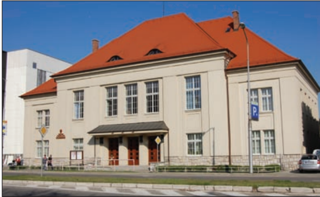
Budova CVČ DOMINO na Štefánikovej triede

a English drama). Pri príležitosti príchodu sv. Cyrila a Metoda zorganizovali dejepisnú súťaž Nitra, moje mesto, dejepisnú súťaž Odkaz sv. Cyrila a Metoda, Solúnski bratia (Zoborská pyramída pre ŠK). CVČ zorganizovalo 245 podujatí s účasťou takmer 15-tisíc detí. Ďalšie nízko-prahové aktivity poskytujú priestory na Hôrke. Vo veľkej miere sa CVČ venovalo reprezentácii súborov a klubov na podujatiach iných organizátorov v rámci mesta, kraja a Slovenska - zaznamenali viac ako sto vystúpení s počtom účinkujúcich vyše dvetisíc. K najúspešnejším krúžkom patria mažoretky, TS EIJA, ako aj TS MADHOUSE, ktoré žnú úspechy na rozličných súťažiach doma aj za hranicami Slovenska. Činnosť v CVČ podporuje mesto Nitra. Žiak s trvalým pobytom v Nitre,