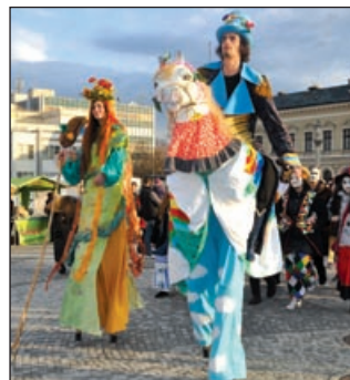
V sprievode zaujali chodúliari z Harry Teater.

Senior, Lehotanka, Baranek, Jaročan Silešánek. Záver fašiangov patril symbolickému pochovávaniu basy v podaní FSK Tradícia Nitra – Dražovce. Príležitosť navštíviť tohtoročný jarmok si nenechali ujsť rodičia s deťmi, pretože deti mali možnosť na vlastné oči vidieť živé domáce zvieratká, ktoré ešte v nedávnej minulosti tvorili súčasť gazdovského dvora ako sú napr. prasiatka, ovečky. Fašiangy spestrila aj jazda na konskom povoze. K vytvoreniu jarmočnej atmosféry prispela aj populárna hudobná skupina PROFIL. (S)