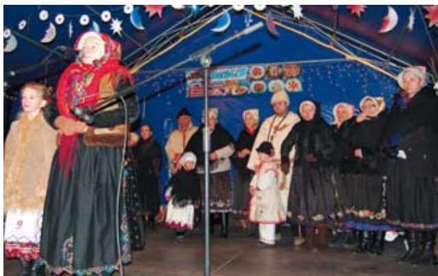
V mestečku bude účinkovať aj OZ Tráďcia z Dražoviec.