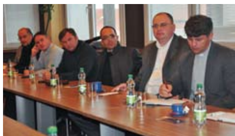
Vedenie mesta sa stretlo so zástupcami farností a cirkví.