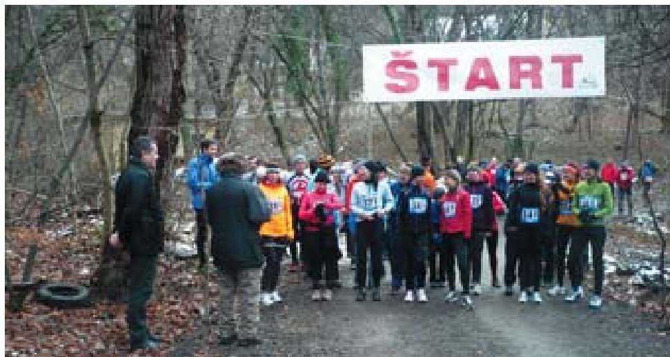
Bežci sa už tradične stretávajú v Nitre v posledný deň roka na Zoborskom silvestrovskom behu, ktorý odštartuje od Špecializovanej nemocnice sv. Svorada Zobor.

Na záver roka je pripravená Veľká cena Nitry v krasokorčuľovaní, ktorá sa bude na Zimnom štadióne konať v dňoch 28. a 29. decembra. Bodku za tohtoročným cyklom športových podujatí urobí Zoborský silvestrovský beh, ktorý v posledný deň tohto roka štartuje napoludnie od Špecializovanej nemocnice sv. Svorada Zobor (bývalého liečebného ústavu). (SY)