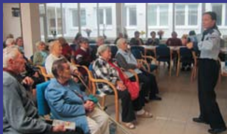
Príslušníci MsP prednášali v Zariadení pre seniorov na tému, ako sa chrániť pred zlodejmi a podvodníkmi.

prednášajúcich príslušníkov nitrianskej Mestskej polície dostali klienti reflexné pásky, ktoré – ako im bolo vysvetlené – by mali nosiť vždy za zníženej viditeľnosti. (ZK)