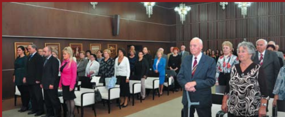
V Obradnej sieni mestského úradu bolo slávnostné prijatie nitrianskych seniorov pri príležitosti Nitrianskeho dňa úcty k starším.