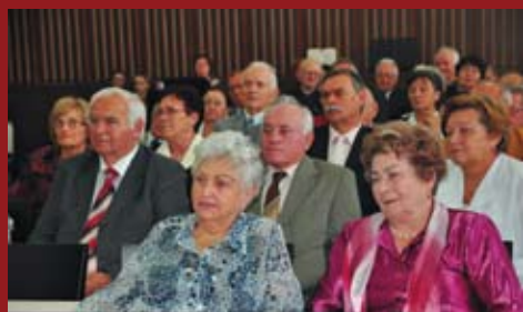
Pohľad na časť zaslúžilých seniorov.