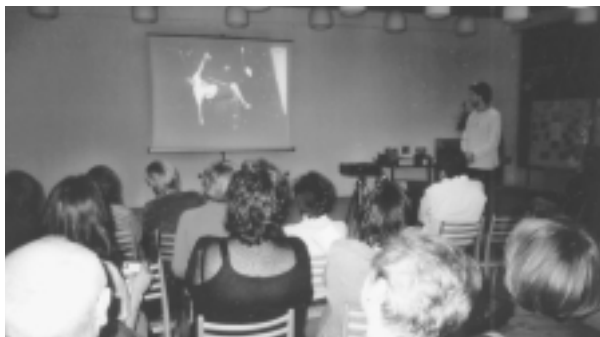
Niektoré projekty predstavili formou videoprojekcie.