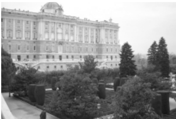
Kráľovský palác s príľahlými záhradami.

Najskôr ma mestom sprevádzal Dr. Chajma. Na námestí Oriente, pred kráľovským palácom, sme stretli neznámý pár v strednom veku, hovoriaci po slovensky. Nechceli sme sa im