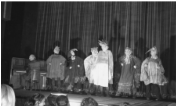
V slávnostnom galaprograme si za slepačí tanec vyslúžila veľký potlesk dámska časť hereckého teamu.