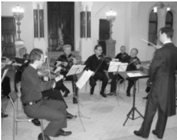
Otvárací koncert Nitrianskej hudobnej jari patril komornému orchestru Czech virtuosi, ktorý do Nitra pricestoval z Brna.